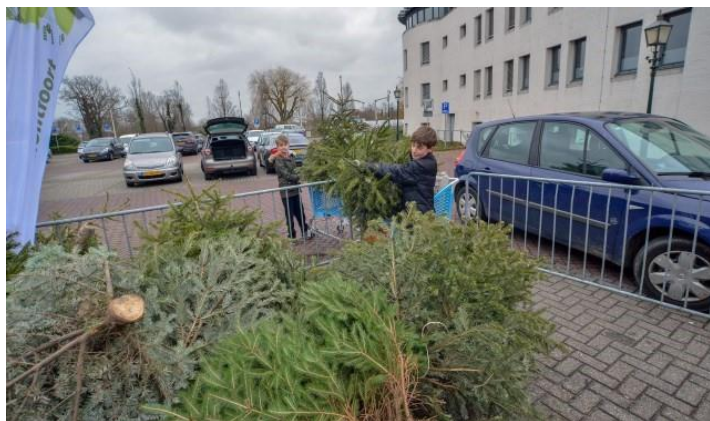
Figuur 1 Foto gemaakt door Paul van Dungen, Zenderstreek

Ieder jaar organiseert de werkgroep Afval de kerstbomeninzamelactie. Mensen kunnen dan hun kerstboom op een aantal plekken inleveren, zodat deze duurzaam verwerkt kunnen worden. De kerstbomen worden namelijk aangeboden voor het opwekken van biomassa. In ruil voor het aanbieden van de kerstboom ontvangen mensen € 0,50. Jaarlijks motiveert dit veel kinderen om kerstbomen in te zamelen en bij onze vrijwilligers te brengen. De